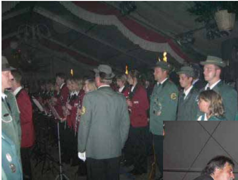
Links: Angetreten zum Zapfenstreich

Auch der Zapfenstreich am Abend war sonst besser besucht. Der Stimmung hat das jedoch keinen Abbruch getan. Und Stimmung haben wir immer. Darin sind wir Weltmeister!